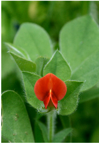
ארבע כנפות מצויות