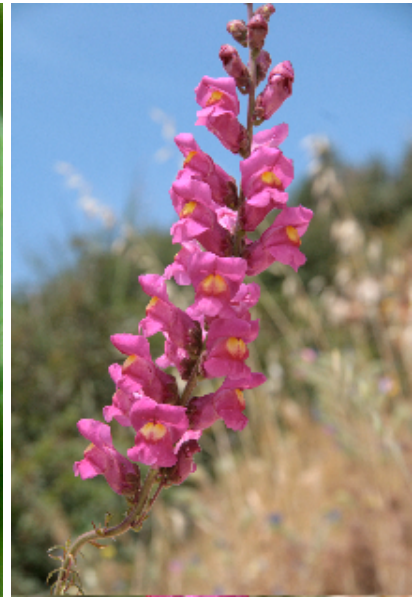
לוע ארי גדול