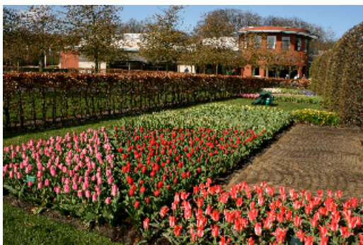
תצוגת צבעונים בקנהוף, הולנד

במופעים של פרחי בר יש ספונטניות טבעית, שאיננה סדורה בקפידה ועל כן תמיד מפתיעה ומרגשת, בעוד שמופעים של פרחי תרבות מאורגנים (בדרך כלל) על פי תבנית מתוכננת מראש ויוצרים רושם מלאכותי או מניפולטיבי. במופע של פרחי בר איננו חשים את היד המכוונת להרשים אותנו, ובכל זאת לעתים קרובות כל כך המראה מעורר התפעלות והתרגשות. בפרחי הבר אנו חשים את רוח החופש ואילו בפרחי תרבות את כבלי הגינונים החברתיים.