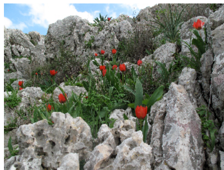
צבעוני ההרים ליד כפר גלעדי

פרחי תרבות הם לעתים קרובות גדולים יותר (גדולים מדי לטעמי), "מושלמים" יותר ובמבחר גדול יותר של גוונים מפרחי בר בני סוגם. תכונות אלה קשורות לאופי המסחרי של הפרחים, המיועדים למכירה או לנוי ליד הבית כחלק מתפאורה. אמנם פרחי תרבות מרשימים כהישג אנושי וכשליטה במנגנוני הטבע, אולם הם סופחים אליהם את כל קווי האופי (שאינם לטעמי) של תרבות הצריכה. בפרחי הבר יש צניעות, עדינות והשתלבות בסביבה בעוד פרחי התרבות כאילו מתחרים זה בזה בכיבוש סביבתם. ואפשר להביא נימוקים